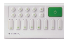
FLS 2 Беспроводная система